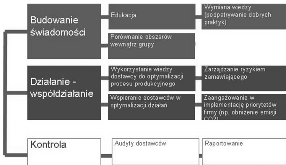
Rysunek 1. Relacje z interesariuszami